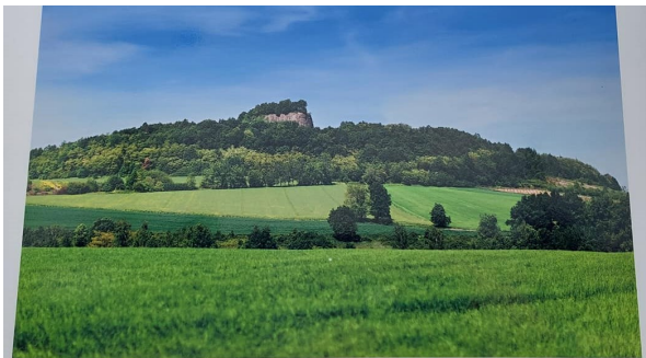
Krajobraz Wilczej Góry | Scenery of the Wolf's Mountain | Landschaft am Wolfsberg | Krajina kopce Wilcza Góra

Poczet sztandarowy Koła Związku Sybiraków w Złotorzy wystawili umundurowani członkowie Oddziału Miejskiego Związku Strzeleckiego „Strzelec” RP.