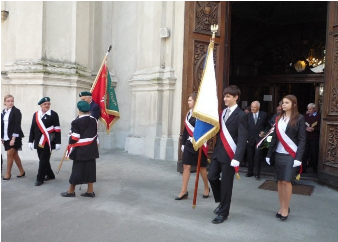
Poczty sztandarowe i uczestnicy uroczystości przed wejściem do kościoła parafialnego p.w. Rozesłania św. Apostołów w Chełmie