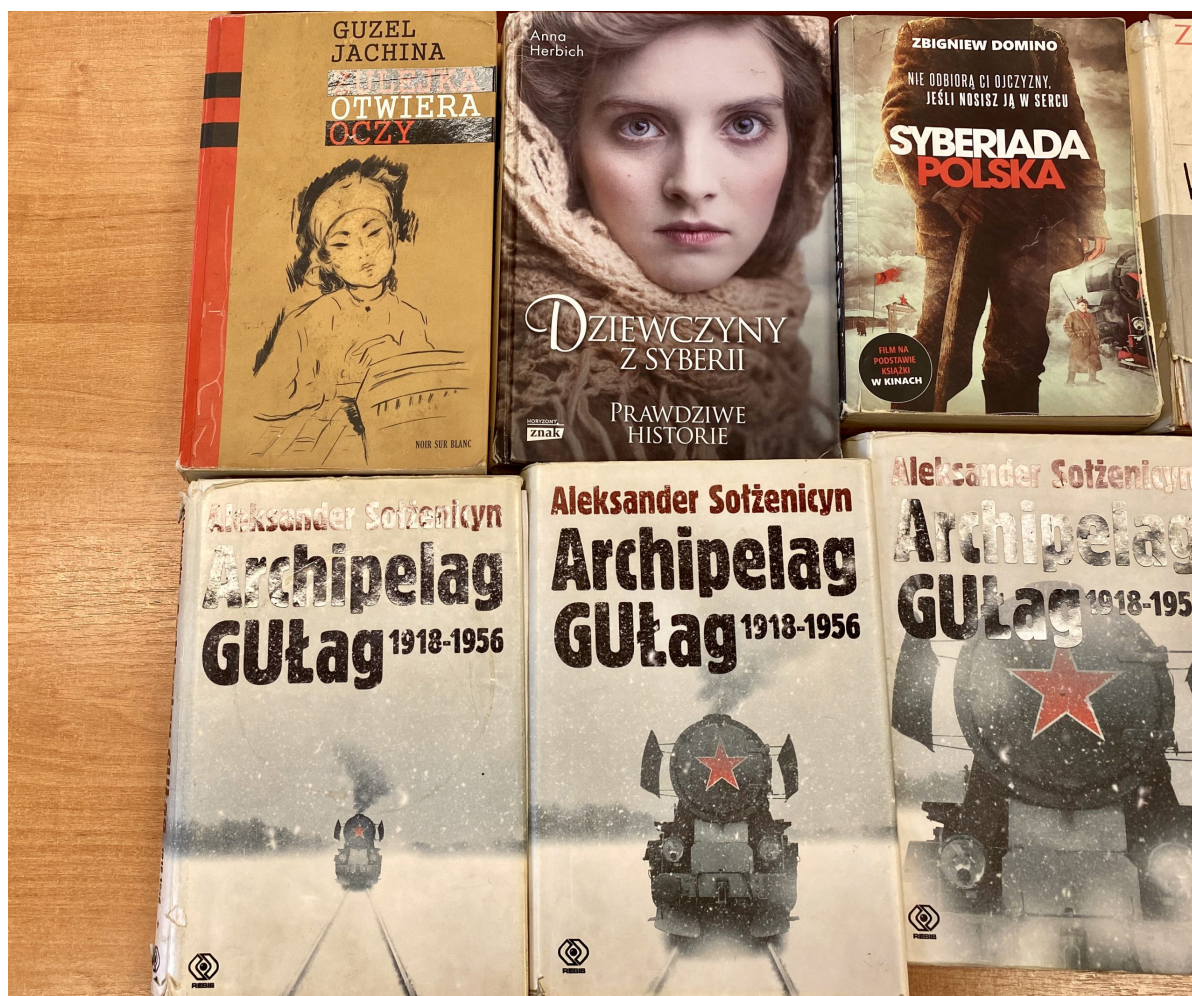
Książki opowiadające o zesłaniach na Sybir