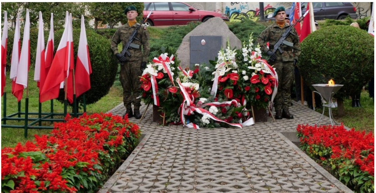
Żołnierska Warta Honorowa oraz wieńce i kwiaty przy Kamieniu Sybiraka w Chełmie