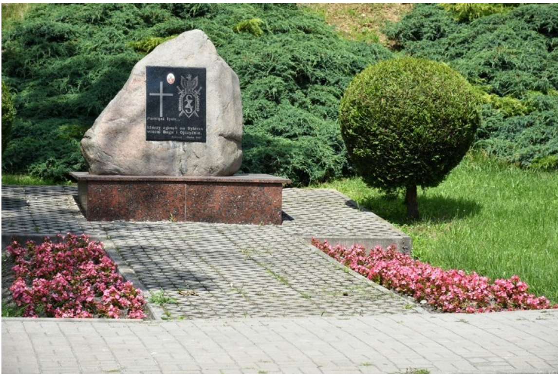
Kamień Sybiraków w Chełmie